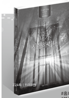
이재록 목사 성경과 권능 시리즈 | 입문편 1